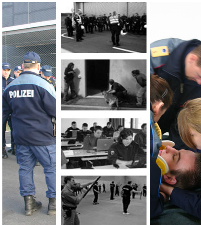
Abbildung1: Praxisnahe Ausbildung der Polizei-Aspiranten auf Ihr späteres Handlungsfeld.

getz für Berufsbildung fordert daher eine stärkere Ausrichtung am Output, der sogenannten Handlungskompetenz. Damit wird das Zusammenspiel verschiedener Faktoren beschrieben: Fachwissen, Methodenkompetenz und persönliches Verhalten müssen kombiniert werden mit der Bereitschaft, die eigenen Erfahrungen zu