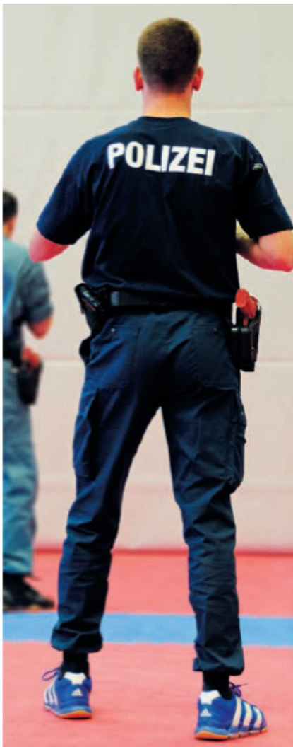
Abbildung 2: Kompetenzorientierte Ausbildungsmethoden

Herzstück dieses Bildungsangebots soll die Kombination von Wissenschaft und Praxisbezug sowie moderne Ausbildungsmethoden und ein professioneller Lehrkörper sein.